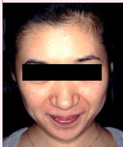
図3) ビタミンA、Cの徹底した外用3ヵ月後。毛穴はほとんど閉じる